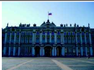
2) Зимний дворец