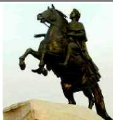
1) Медный всадник

1. Какую из указанных ниже достопримечательностей Наташа и Толя могут показать гостям в своём городе? Обведи номер ответа.