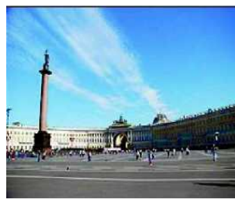
4) Дворцовая площадь